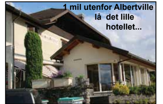
1 mil utenfor Albertville lå det lille hotellet...

“Her får jeg bli”, tenkte jeg, parkerte bilen og gikk inn - ingen resepsjon, men en hall hvor det kom en hyggelig franskmann (de finnes), fikk mitt rom som var ok. Hver dag etter jeg kom til et nytt sted bevilget jeg meg ett glass øl, det fortjente jeg, slik også her. Min nye franske venn var elskverdigheten selv, han åpnet døren til terrassen hvor det var sol. Ved siden av terrassen var restauranten. “Så fint det er her”, tenkte jeg, drakk mitt velfortjente øl, og reserverte bord til kvelden. Det viste seg at restauranten var en Michelin-anbefalt restaurant, en av de bedre - det hadde booking.com ikke fortalt. Jeg spiste den beste foiegras jeg noen gang har spist, og middagen var eksellent, et mann-og-kone-sted, hun serverte og han var på kjøkkenet. Alt i alt en god opplevelse. Men det var jo ikke booking.com sin skyld, jeg ville til Albertville og de sendte meg et helt annet sted. Hvis jeg hadde vært kjent i området, så hadde