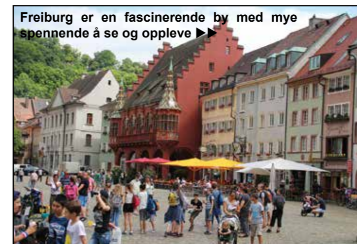
Freiburg er en fascinerende by med mye spennende å se og oppleve ►►