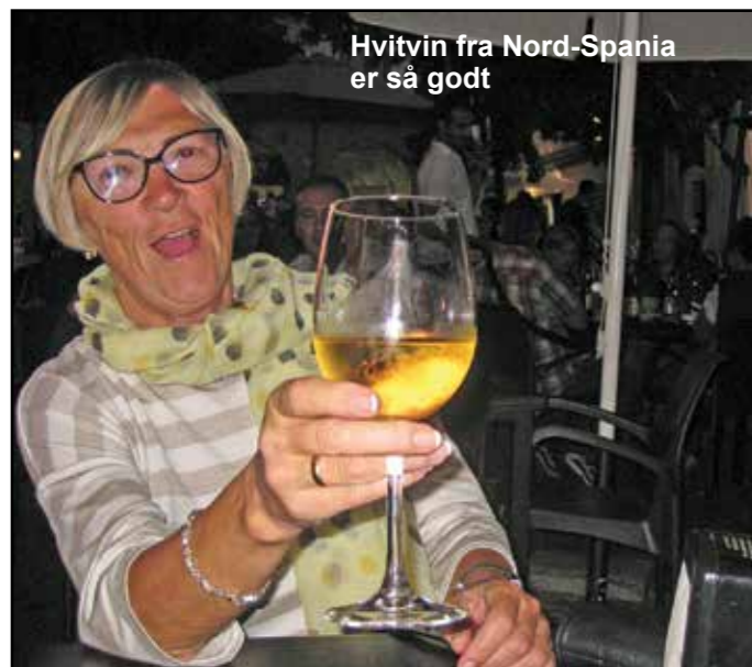
Hvitvin fra Nord-Spania er så godt