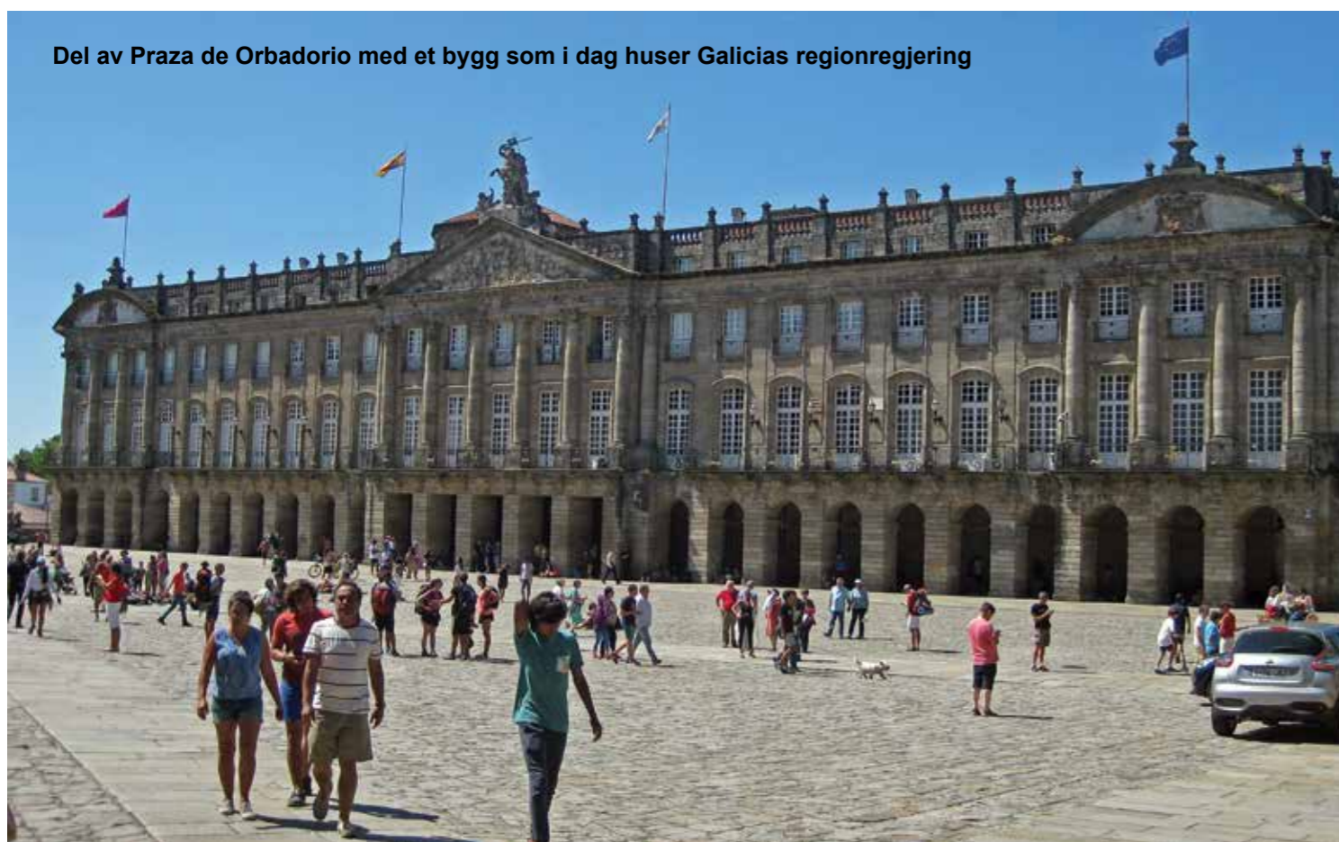
Del av Praza de Orbadorio med et bygg som i dag huser Galicias regionregjering