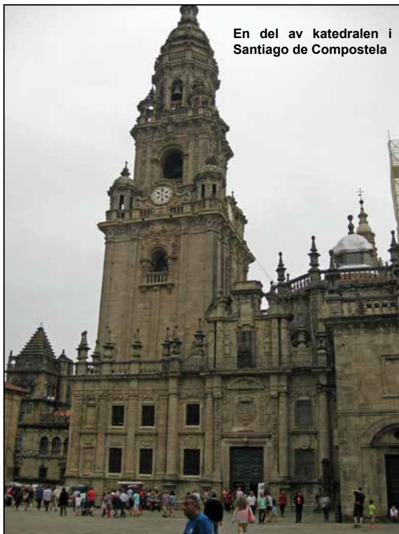
En del av katedralen i Santiago de Compostela