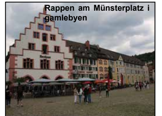
Rappen am Münsterplatz i gamlebyen