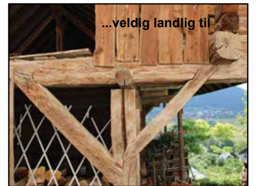
...veldig landlig til