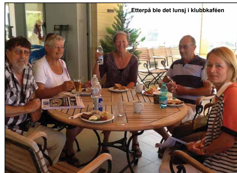
Etterpå ble det lunsj i klubbkaféen