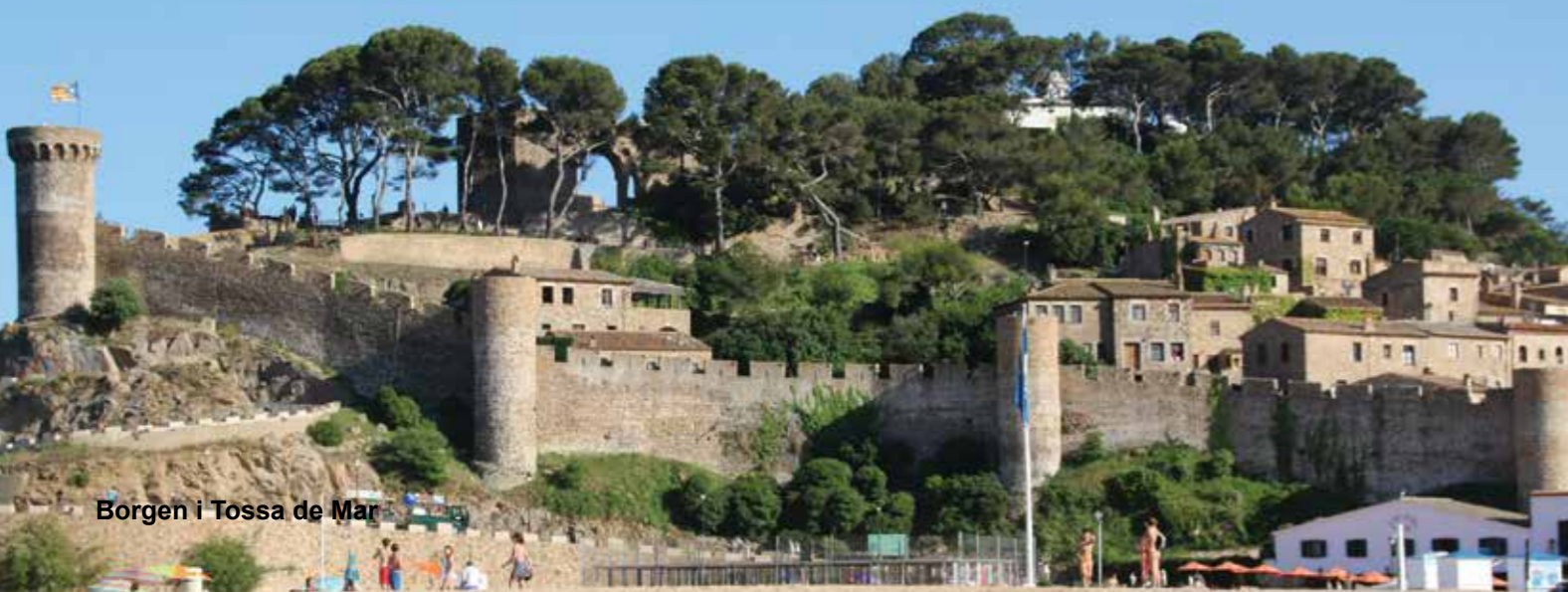
Borgen i Tossa de Mar