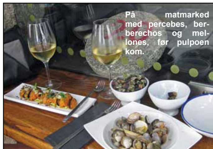
På matmarked med percebes, berberechos og melones, før pulpoen kom.