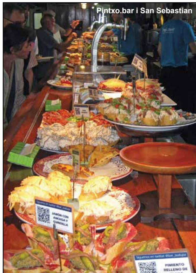
Pintxo.bar i San Sebastian

mot havet rundt en kurvet bukt med en fin sandstrand. Midt i bukten ligger en skillpaddeformet øy som skjærer for bølger og på hver side av bukten reiser de grønne toppene Monte Urgull og Monte Igeldo seg. På Monte Igeldo, som kan nås med en «funicular» a la Fløybanen i Bergen, ligger et hotell og en gammeldags fornøylespark. På Monte Urgull, som man må gå til fots opp til, ligger en festning fra 1500-tallet, som inneholder et lite museum som viser byens historie. På toppen av festningen står en statue av Kristus som er synlig fra hele byen. Bukten består av en fin strand med en elegant tradisjonell strandpromenade som er flankert av vakre bygninger fra slutten av 1800-tallet og begynnelsen av 1900-tallet. Byen har en gammelmodig, fasjonabel atmosfære. På begynnelsen av 1900-tallet var San Sebastian den mest eksklusive sommerbyen i Spania. Det hele startet med at dronningen la sin sommerresidens hit på slutten av 1800-tallet, noe som også trakk det spanske aristokratiet hit, og på begynnelsen av 1900-tallet, under «la belle époque», var San Sebastian lekegrind for de rike og berømte i Europa. I dag kan vi alle dra dit, og det er det mange som gjør. Her foregår det mye, sommeren er full av festivaler av ulike slag. San Sebastian er også et eldorado for matelskere, her finnes flere restauranter med Michelinstjerner, og hit kommer mange bare for å spise. Det er ingen overdrivelse å påstå at gastronomi er byens store turistattraksjon.