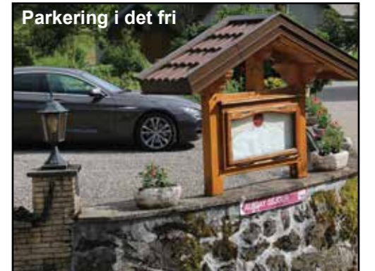
Parkering i det fri