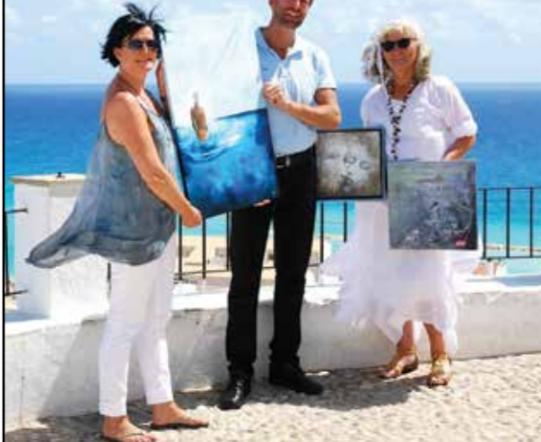
Utstilling på Casa Vital

Høstsesongen i Kunstgruppen starter egentlig med Vernissage i klubben og medlemsmøte den 29. september. Men aktivitetene har startet allerede.