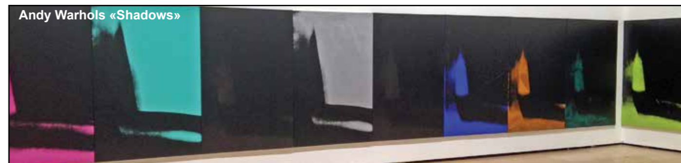
Andy Warhols «Shadows»

Når man vandrer fra bar til bar i gamlebyen i San Sebastian, kan man ønske at oppholdet her aldri tar slutt, men det gjør det. Vi må videre, men bare til Bilbao, hvor en busstur på noe over en time frakter oss de knappe ti milene. Bilbao er en gammel industri- og havneby som ble hardt rammet da økonomien ble modernisert og utsatt for internasjonal konkurranse etter Franco-tiden, men byen ble rustet kraftig opp på 1990-tallet og fremstår i dag som en moderne velutviklet by, og er et viktig sentrum for finans- og service-sektoren. Det første vi gjør da vi ankommer Bilbao,