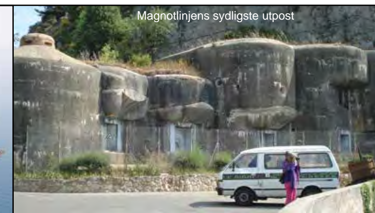
Magnotlinjens sydligste utpost