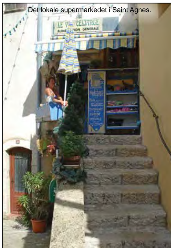
Det lokale supermarkedet i Saint Agnes.