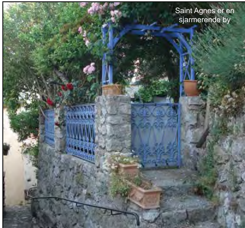
Saint Agnes er en sjarmerende by

Med den tredje overnattingen forlot vi storbyene og de «normale» hotellene, og jeg hadde booket oss inn på et lite og, viste det seg, temmelig primitivt hotell et godt stykke opp i «Alpes-Maritime», eller de maritime alper, som ligger nesten helt ned til rivieraen ved den italienske grensen. For å komme til byen, som heter Sainte-Agnés, måtte vi kjøre av motorveien ved byen Menton og følge en usedvanlig kronglete og smal vei som snodde seg frem og tilbake under motorveien (tror vi passerte under motorveien 6 ganger), før den kronglet seg oppover fjell-sidene. Da vi endelig nådde frem og fant vårt sted (som for øvrig hadde fått meget god kritikk på Trip Advisor) var belønningen en storslått utsikt over Menton og Middelhavet. Vi spiste middag på hotellets terrasse, der utsikten var fantastisk. Dessverre viste deg seg at utsikten var det beste ved dette hotellet. Middagen var grei, vinen dyr og under middels, rommet luktet muggent, og om ikke det var nok – ved femtiden om morgenen satte det i gang et forferdelig spektakkel rett over hodene våre. Det viste seg å være et slags aircondition-anlegg som satte i gang, men det hørtes mest ut som en sementblander full av stein. Da vi klaget på det ved frokosten fikk vi liten respons, kun et lite «hm» og litt hoderisting.