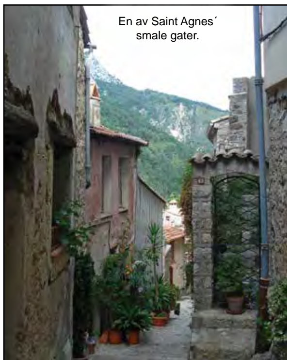
En av Saint Agnes' smale gater.