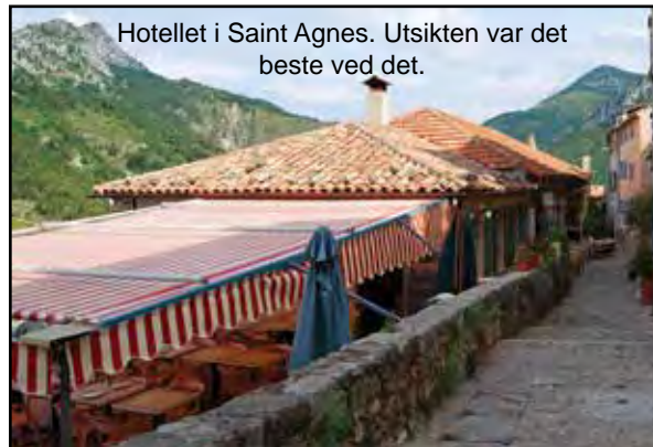
Hotellet i Saint Agnes. Utsikten var det beste ved det.